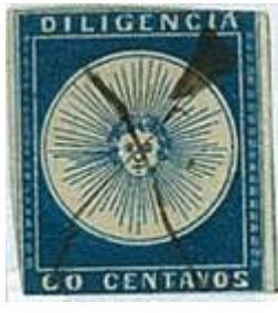
Azul oscuro. Ex Lee (C3)