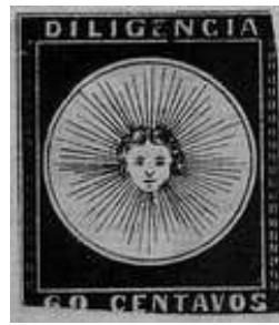
Variedad "E" cortada. A.Fita (R14). Color Indigo