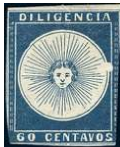
Azul oscuro; Var. mancha blanca c/ margen superior muy amplio. Ex Bustamante. (R2)