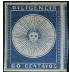
Azul; parte sello a derecha. Mejor ejemplar existente. Ex - Casparry (R2)