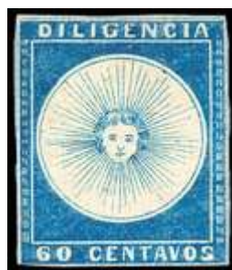
Azul, todos los márgenes justos. (C3)