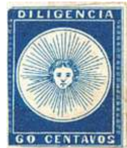
Índigo. Sobre pequeño fragmento; figura en libro de Lee. (C3)