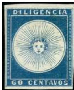
Azul; amplios márgenes, derecho con marco del sello vecino. Ex Sciarra. (R3 y R7)