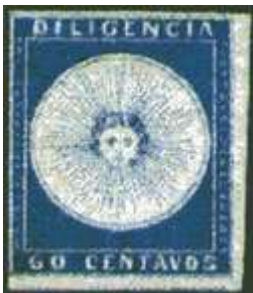
Azul oscuro; dos márgenes grandes. (R4 / 2000).