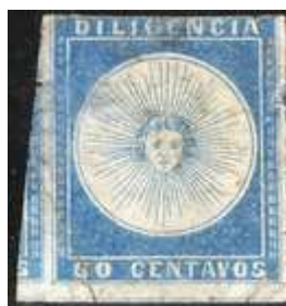
Azul celeste. 3 amplios márgenes. Único que muestra parte de otro sello y marcos de otros 2 (Malosetti) (*1)