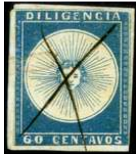
Azul; Variedad "E" cortada. Margen izq c/marco sello vecino. (R3)