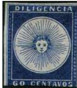
Índigo; amplio margen izquierdo. (R2)