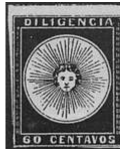
Gran margen sup. que permite ver marco sello sup. (R12). (C2)