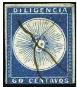
Azul oscuro. Sin mas datos.