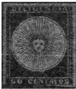
Índigo; margen inferior tocado (R5)