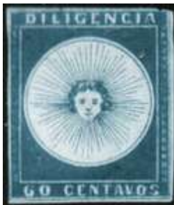
Azul oscuro; margen superior justo. (R4 / 1996).