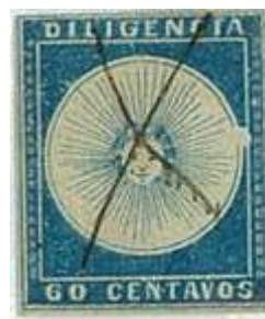
Azul pálido. Variedad mancha blanca (C3)