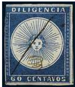
Índigo; amplio margen derecho con parte marco del sello vecino. (R2)