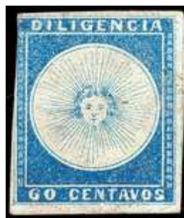
Azul, amplio margen der. Con marco del sello siguiente. (C3)