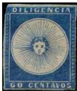
Azul (R2) Euros 2.160