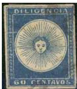
Azul oscuro. Sin mas datos.