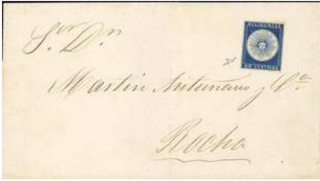
Carta franqueada de Montevideo a Rocha (Martín Antuñano) con sello índigo. Fechada 29 de Noviembre de 1858. Con buenos márgenes; solo existen 3 cartas con este tono de color. Ex Hoffmann.