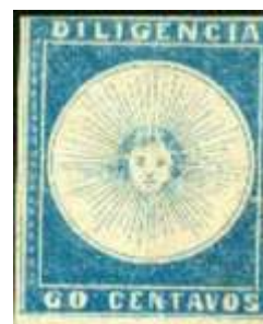
Azul. Sin mas datos.