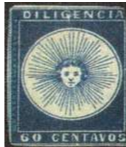
Índigo; margen derecho cortado; otros justos. (R5 /2005-07).