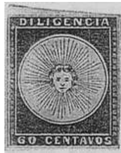
Azul oscuro; permite ver marco sello superior (R12). (C1)