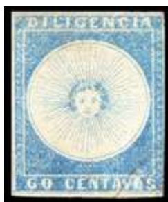
Azul celeste. Sin mas datos.