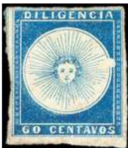
Azul. Variedad mancha blanca; figura en libro de E.J.Lee. (C3)