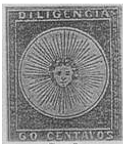
Índigo; marco fino; se ve marco del sello derecho (R12). (C1)