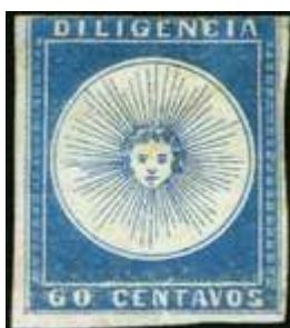
Azul; amplio margen izquierdo e inferior. Ex Lee. (R3 y R8)