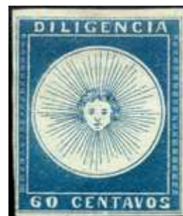
Azul; amplios márgenes, sup. y derecho con marco sellos vecinos. (R3 y R7)