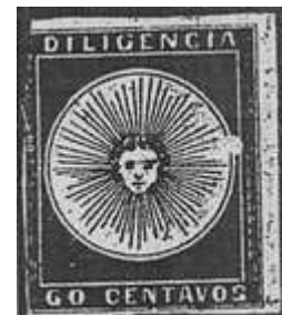
Var. mancha blanca c/ margen derecho muy amplio (R12). (C2)