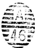
Ej: 12 barras; 26 x 20 Barras medianas; formato mediano