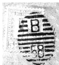
Ej: 13 barras; 28 x 19 Barras medianas; 3 separan Letra y Nros