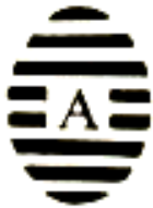
Letra A grande

Corresponde a los creados en 1866 – Utilizados en la Sucursal Central de Correos desde 1866 hasta 1883 en que se ponen en uso matasellos similares pero que combinan letras y Nros (o solo letra para e caso de la Sucursal Central) formados con 12 barras.