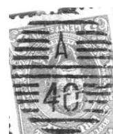
Ej: 14 barras; 25 x 21 Barras medianas; formato mediano