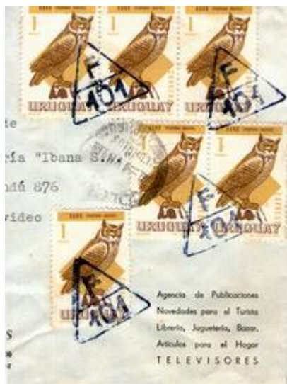
Gran fragmento de sobre circulado de Colonia a Montevideo el 4 de julio de 1969. F-101 corresponde a Paraje Vecinal Colonia.

A continuación algunos ejemplos sobre piezas completas o fragmentos: