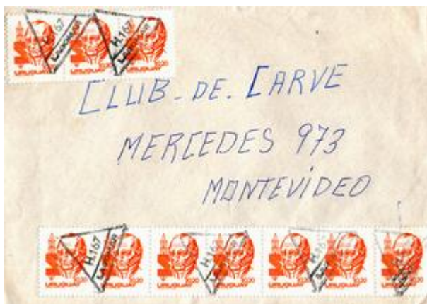
Sobre circulado de Lagomar a Montevideo franqueado con emisión de 1980. Corresponde al 2do tipo con texto "LAGOMAR" bajo el código H-167.

Con respecto a las nros de agencias identificados hasta la fecha son las siguientes (no se incluyen los de hospital por haber sido detallados anteriormente):