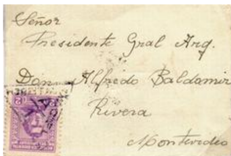
Pequeño sobre circulado en Montevideo franqueado con emisión de 1941. A-1 corresponde al Hospital Maciel.