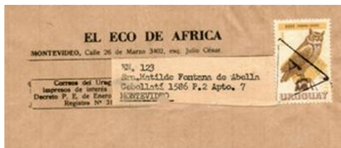
Faja de periódico (impresos) circulada en Montevideo; fechado al dorso 6/12/1969. A-5 corresponde a Sucursal Peñarol.