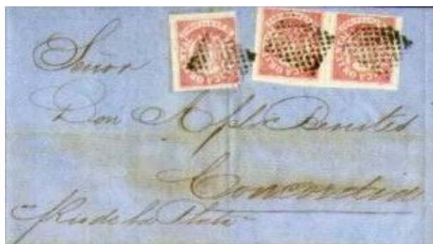
Pieza circulada de Montevideo a Concordia; franqueada con 3 escuditos de 6 cts cancelado con matasello tipo grilla de puntos. Son raras las piezas con sellos cancelados con este matasellos mudo y excepcionales con franqueo múltiple..

La cancelación de Rejilla (o Grilla de puntos) es mas algo mas rara que la de Sol Naciente; su aplicación mas común es sobre “Escuditos” aunque también aparece sobre algunos Soles cifra fina y gruesa.