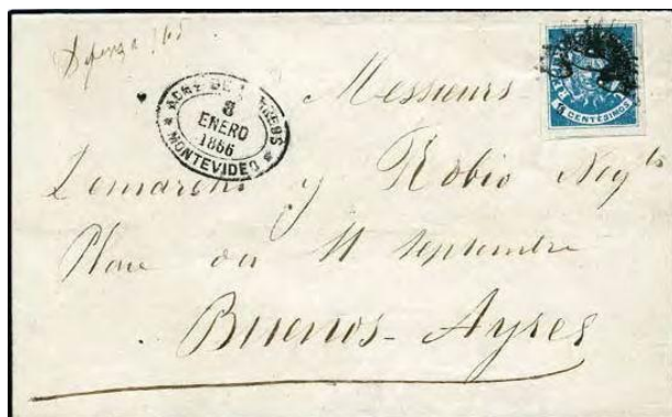
Pieza circulada de Montevideo a Buenos Aires . Franqueada con sello escudito resellados de 5 cts (Yvrt 24) cancelado con "Sol Naciente". En el sobre fechador ovalado del 8 de Enero de 1866 que demuestra su aplicación en Montevideo.

Nota: El matasellos “Sol Naciente” es mencionado en alguna literatura como correspondiente a la localidad Río Branco pero ello es erróneo ya que esta comprobado que se aplico en Montevideo.