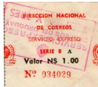
1978 – Serie “B” – A Valor N$ 1.00 c/gomígrafo de TREINTA Y TRES