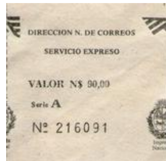
1991 – Serie “A” Valor N$ 90.00