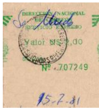
1981 – Valor N$ 2.00