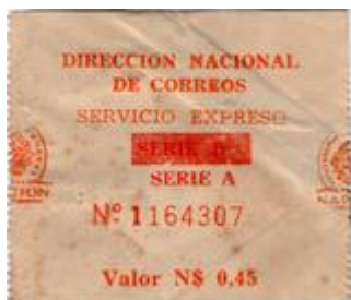
1975 – Serie “A” corregida; bajo tachadura dice “SERIE B”