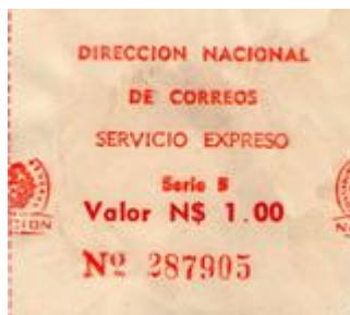
1978 – Serie “B” Valor N$ 1.00