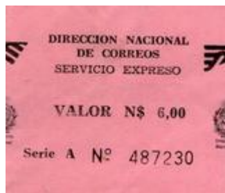
1987 – Serie “A” Valor N$ 6.00