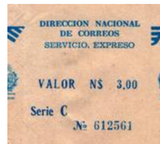
1984 – Valor N$ 3.00