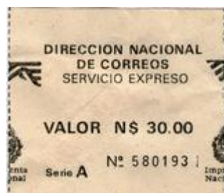
1989 – Serie “A” Valor N$ 30.00