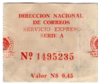
1976 – Serie “A”