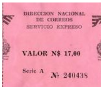
1987 – Serie “A” Valor N$ 17.00