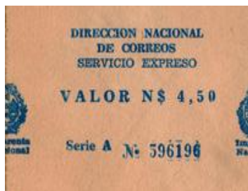
1984 – Valor N$ 4.50