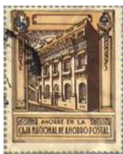
Viñeta de la Caja Nacional de Ahorro Postal utilizada en correspondencia de los años 30.