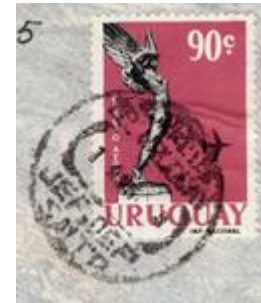
Fechador similar con texto CORREOS DEL URUGUAY – JEF. DEP. SALTO.