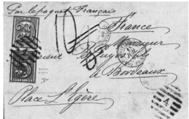
Lote 7830: Carta circulada a Francia que no debería llevar sellos. Se agregaron sellos de 5 y 20 cts con matasello de barras 4 que se encuentran en manos de particulares

Otro ejemplo de piezas fraguadas combinando sellos y marcas tanto verdaderas como falsas son las famosas piezas del vuelo del aviador Kingsley. En peritaje realizado por J. Ebbeler en agosto de 1975 (ref.06) se menciona la existencia de cinco tarjetas fraguadas atribuidas a este vuelo. A estas piezas se les aplicó un matasello especial con el texto "AEREO RAID - Mont. Colonia Salto Bs. As. Mont." en 2 líneas y sin marco.