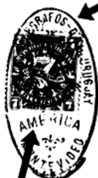
Falso Nro. 2