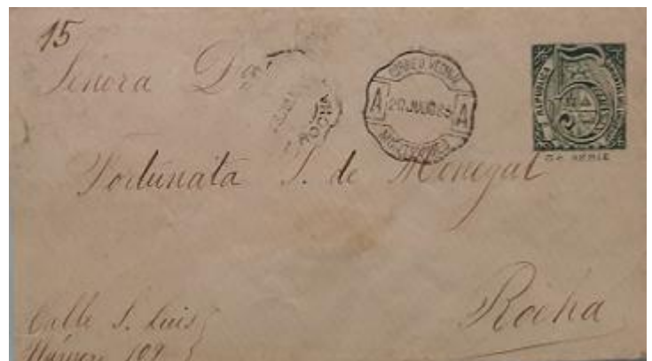
Lote 220 – Uruguay – EP 8a. U. de Montevideo a Rocha con matasellos octagonal de correo vecinal – Base 300