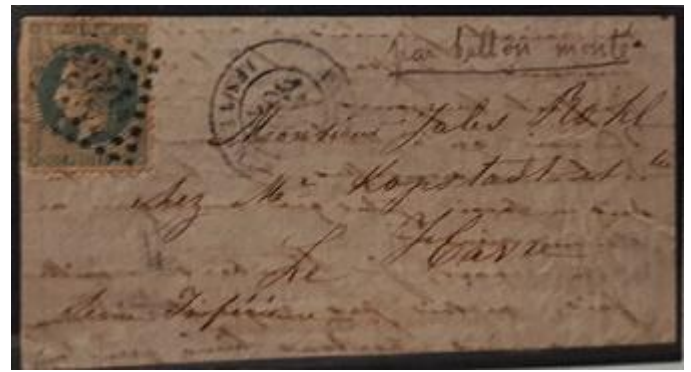
Lote 47 – Francia - 1870 - Transporte de correspondencia cumplida - BALLON MONTE – Base 3.500