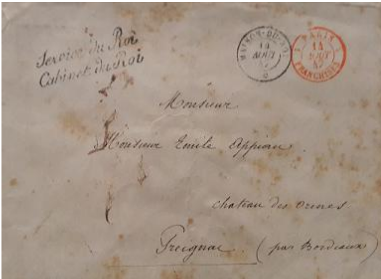
Lote 45 – Francia - 1847 - Prefilatélico - correspondencia con marca casa real francesa – Base 900