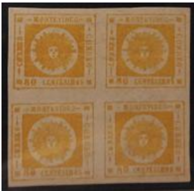
Lote 139 – Uruguay – 14 N. Cuadro con goma. PP. Tipos 7, 8, 1, 2 Impecable pieza – Base 14.000