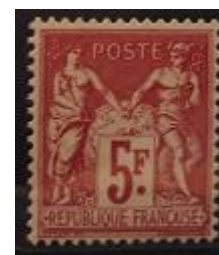
Lote 53 – Francia – 216 N Base 1.600