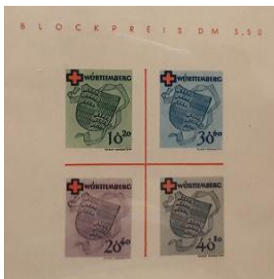
Lote 5 – Alemania - Est.antiguos – Block 1. Sin dentar y sin goma – Base 2.150