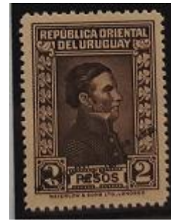
Lote 177 – Uruguay – 377 Invert - "Specimen" Prueba de color 1929 – Base 800