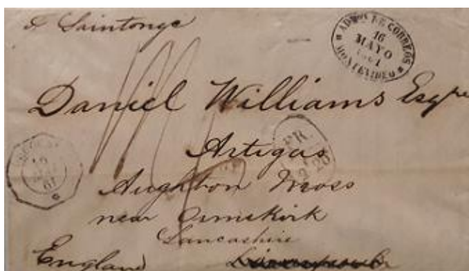
Lote 222 – Uruguay – Carta de Montevideo a Inglaterra, se le aplica la marca de cambio entre Francia e Inglaterra en ovalo achatado dentro "FR 2,20". Se le aplica marca de procedencia octagonal "Uruguay 16.5.1861" – Base 2.500