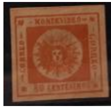
Lote 132 – Uruguay – 8 N. con goma insignificante PP cuatro amplios márgenes. Tipo 11 – Base 2.000