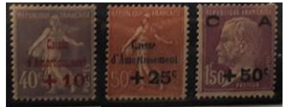
Lote 54 – Francia – 249 al al 251 N. - Base 1.000