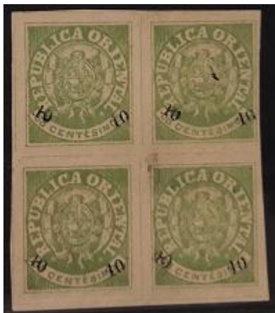
Lote 147 – Uruguay – 25 N. Cuadro. De lujo tipos 1 – 7 – Base 12.000