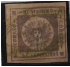
Lote 130 – Uruguay – 7 U – tipo 14; matasello doble ovalo en verde “Arredondo” casi completo – Base 650