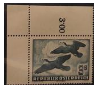
Lote 35 – Austria – 57 Aéreo N. Mint – Base 1.750