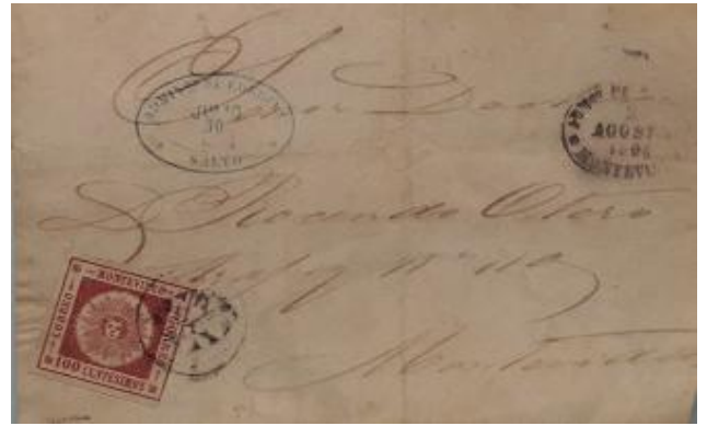
Lote 227 – Uruguay – 15 a (carmin) en frente de carta de Salto a Montevideo, matasellos hoja de roble en negro y ovalo de Salto en color azul con recepción. Muy buen estado y raro – Base 5.500