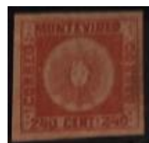
Lote 128 – Uruguay – 6 N. con goma cuatro amplios márgenes. Tipo 16 – Base 900