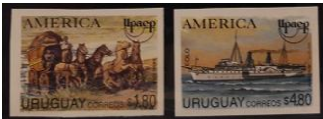
Lote 206 – Uruguay – 1487 y 1488 Mint. SS. UPAEP. Variedad sin dentar total – Base 380