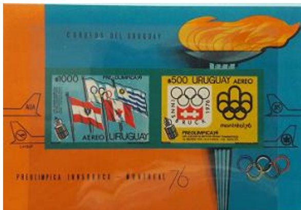
Lote 221 – Uruguay – HB 27 A. Mint. Variedad sin dentar total, muy raro y no catalogado – Base 800