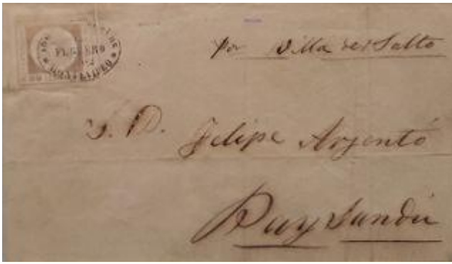
Lote 226 – Uruguay – 13 en sobre primer pliego de carta con raro color "pardo gris" de Montevideo a Paysandú "por Villa del Salto" con matasellos de Montevideo en negro del 1862, tipo 1, excelente pieza – Base 2.500