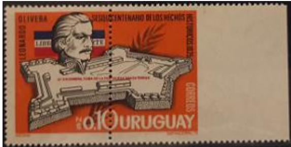
Lote 194 – Uruguay – 914 c. Mint. Buena variedad – Base 220