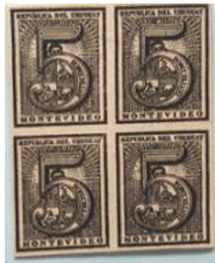
Lote 240 – Uruguay – 30 Ensayo en cartón negro – Base 1.900