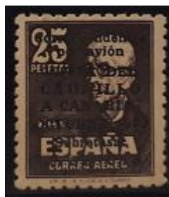
Lote 42 – España – Aereo 246 N. Caudillo a Canarias– Base 4.250