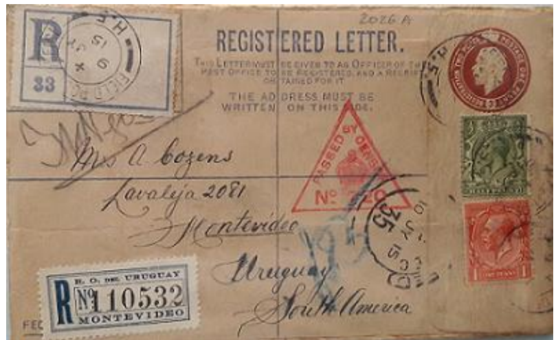
Lote 57 – Gran Bretaña - Entero postal complementado circulado Recomendado a Montevideo el 10 de julio de 1915. Censura y marcas de control y recepción en Montevideo. Interesante – Base 500