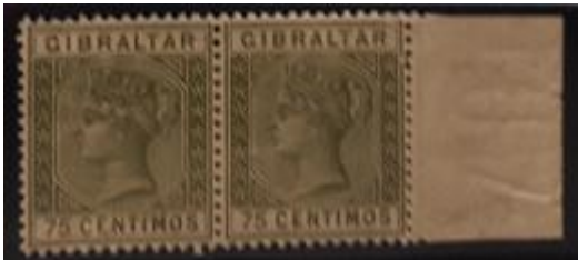
Lote 55 – Gibraltar – 35 Scott (x2) 1889 - Base 750