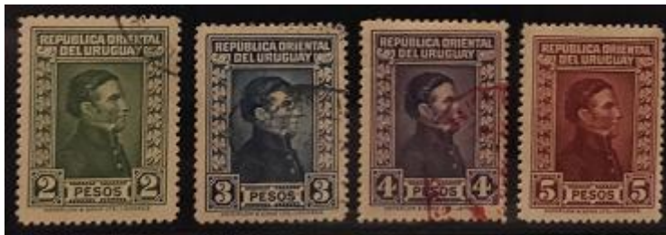
Lote 176 – Uruguay – 377 al 380 SS. U. 380 N. - Base 900