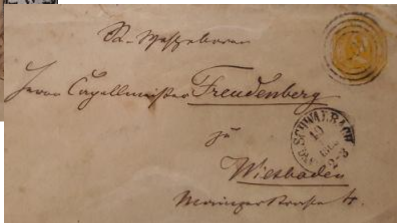
Lote 2 – Alemania - 1886 - Postal circulada por la firma que tenía el monopolio de tour y taxis – Base 650