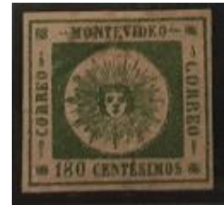
Lote 135 – Uruguay – 11 U – tipo 6; marca muy leve – Base 400