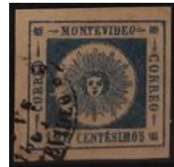
Lote 142 – Uruguay – 16 d U – tipo 11 MBE; Cancelación ovalo Montevideo Nov. 1866 – Base 600