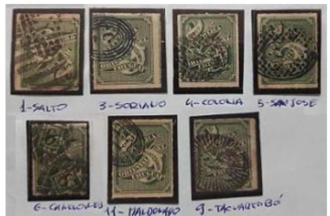
Lote 158 – Uruguay – 40 U x 7 ejemplares con diferentes matasellos fantasía del año 1876 – Base 250