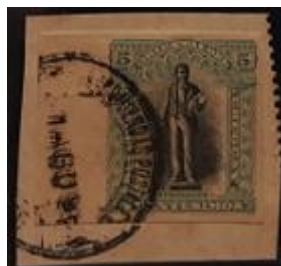
Lote 169 – Uruguay – 115e. U. Muy raro – Base 800