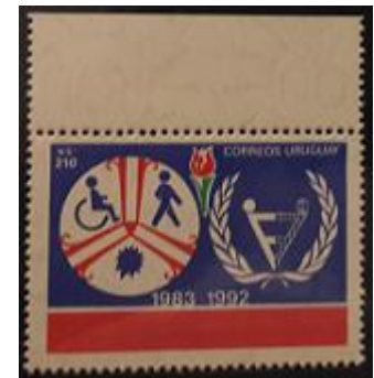
Lote 203 – Uruguay – 1286 a Minit – Base 250