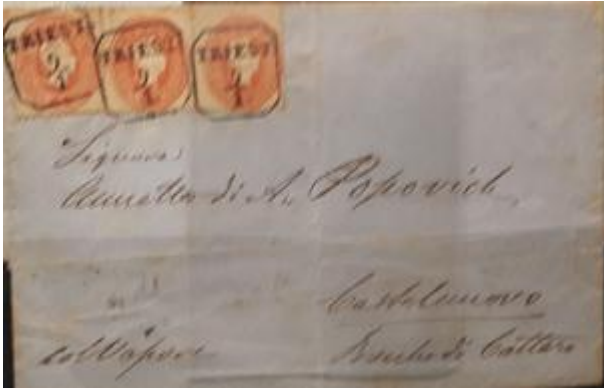
Lote 78 – Trieste – Carta completa con tres sellos de 5 de Austria – Base 3.000