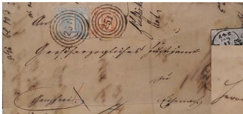
Lote 1 – Alemania - 1861 - Carta circulada por el sistema de tour y taxis el 5 de nov de 1861 – Base 900

Nota: El intercambio NOTABLE del próximo 16 de noviembre contiene 256 lotes, aquí solamente se presenta una selección de imágenes de algunos de los mismos. Por la información completa todos los lotes o en caso de diferencias referirse al boletín del mismo; todas las bases están en $ Uruguayos; las imágenes NO están a Escala. Será llevado a cabo a la H.16.30 en la sede de nuestro Club (Gaboto 1215). OFFERTAS: Tel 2 413 1093 / clubfilatelicodeuruguay@gmail.com