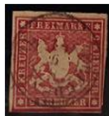
Lote 8 – Alemania - Est. antiguos – 14 U– Base 1.000