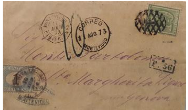
Lote 230 – Uruguay – 36 en carta de Montevideo a Genova matasellado con rombo parrilla según tarifa de la época. Rara tasa de cambio – Base 2.500