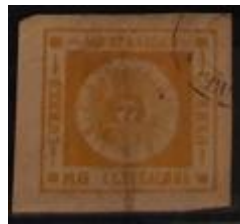
Lote 140 – Uruguay – 14 U. Tipo 7. PP. Amplios márgenes – Base 300