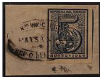
Lote 152 – Uruguay – 30 s/fragmento cancelado con doble ovalo de Paysandú completa. MBE – Base 300