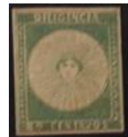
Lote 126 – Uruguay – 2 N. 4 márgenes muy buena reparación – Base 3.000