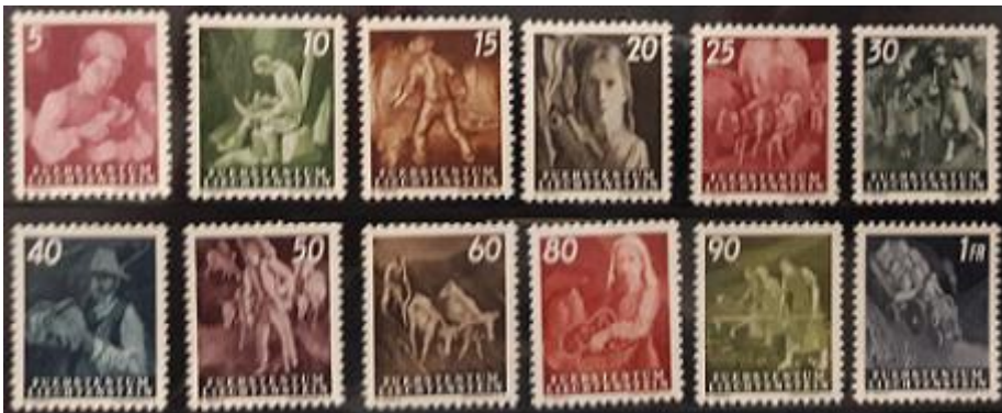
Lote 70 – Liechtenstein – 251 al 262 N. Mint – Trabajadores – Base 1.700