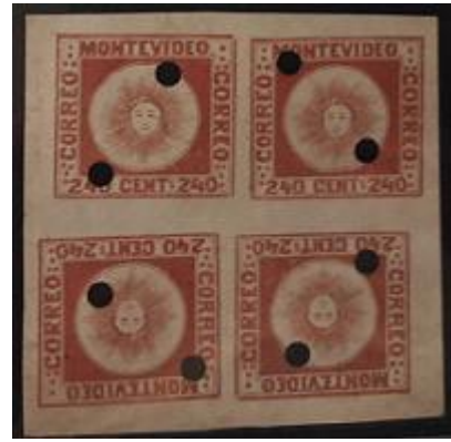
Lote 127 – Uruguay – 6 Cuadro falso perforado. Raro; aparece en Libro Lee – Base 5.000