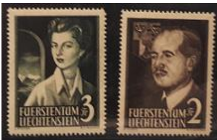
Lote 71 – Liechtenstein – 294 y 295 N. Mint – Base 2.400