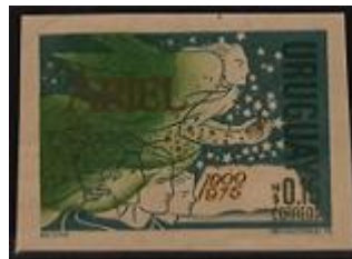
Lote 198 – Uruguay – 933b Minit – Base 320