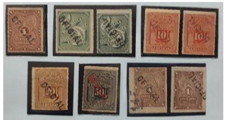
Lote 209 – Uruguay – 1 N, 2 U, 2b N (sc invertida), 3 N, 3b N (sc invertida), 4 N, 4b N (sc invertida), 6 N, 7 N. Emisión 1880 – Base 350