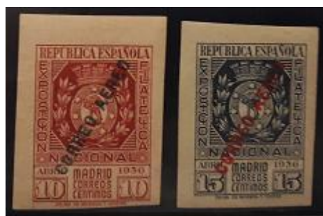
Lote 41 – España –Aéreo 11/112 Nuevo – Base 4.000