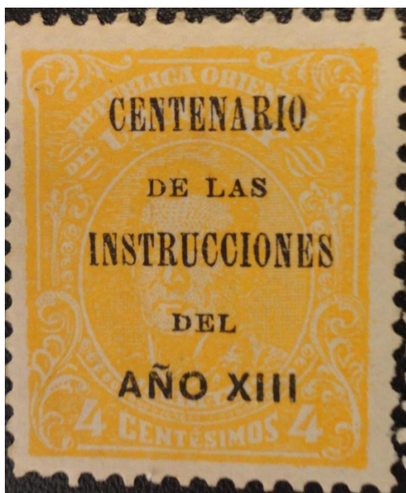
Ci_212 con S/C Auténtica

Pero también hay sobrecargas en posición normal más burdas, con letras en otros estilos, de trazos más gruesos y con letras en mayor tamaño. Es el caso del sello que sigue: