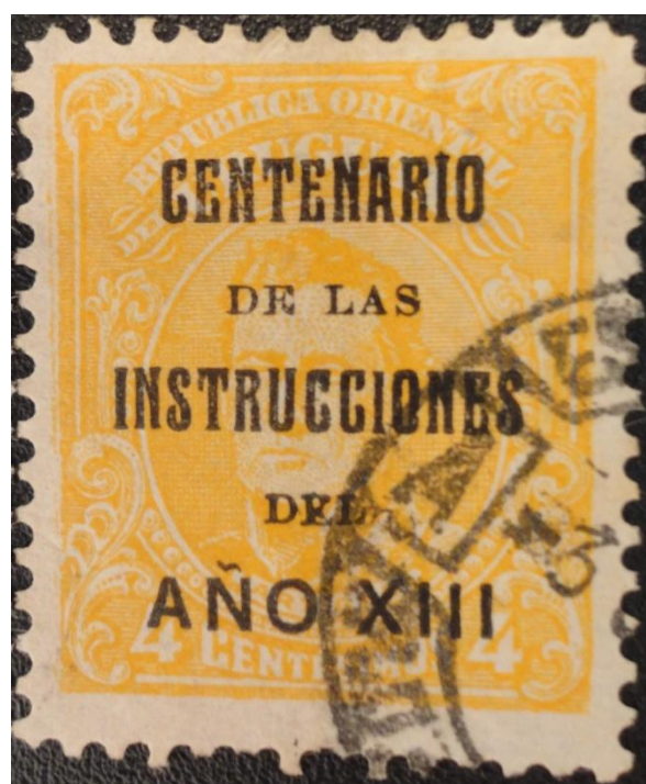
Ci_212 con S/C FALSA