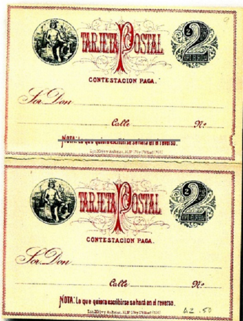
La tarjeta doble de 2 centavos de la emisión uruguaya de 1877

Retiradas de circulación el 1º. de junio de 1881. A.F.E.