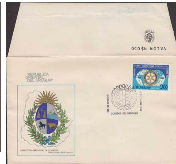
Sobre tipo FDC 7 de N$ 0.50 con sello del 1969, Yv&Te A354 El mismo gomígrafo utilizado mas adelante en sobre del 1977