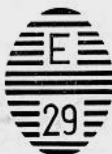
Dolores Ult. Hora