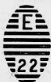
Mercedes U. H. (2)