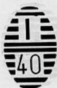
Sauce del Yi