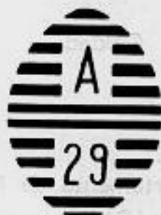
Calle Municipio 1609