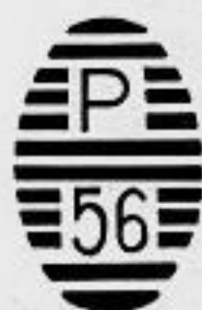
Ag. U. H. de "33"