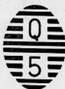
Puntas de Manantiales