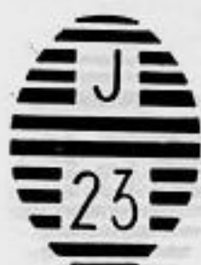
Palmares de Porrúa