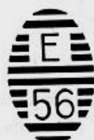
Puntas del Perdido

(1) y (2) Dos matasellos completamente diferentes para la misma localidad, el N° 2 fue usado después, por deterioro del primero.