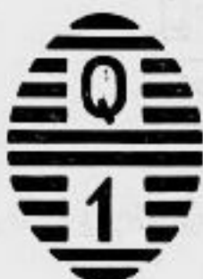
Trinidad U. H.