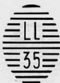
Minas U. H.