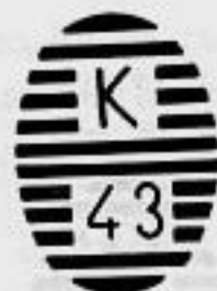
Paso de la Laguna