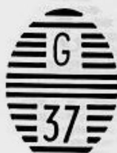
San José U.H.

Dos matasellos con diferente número para la misma Agencia U. H. de San José.